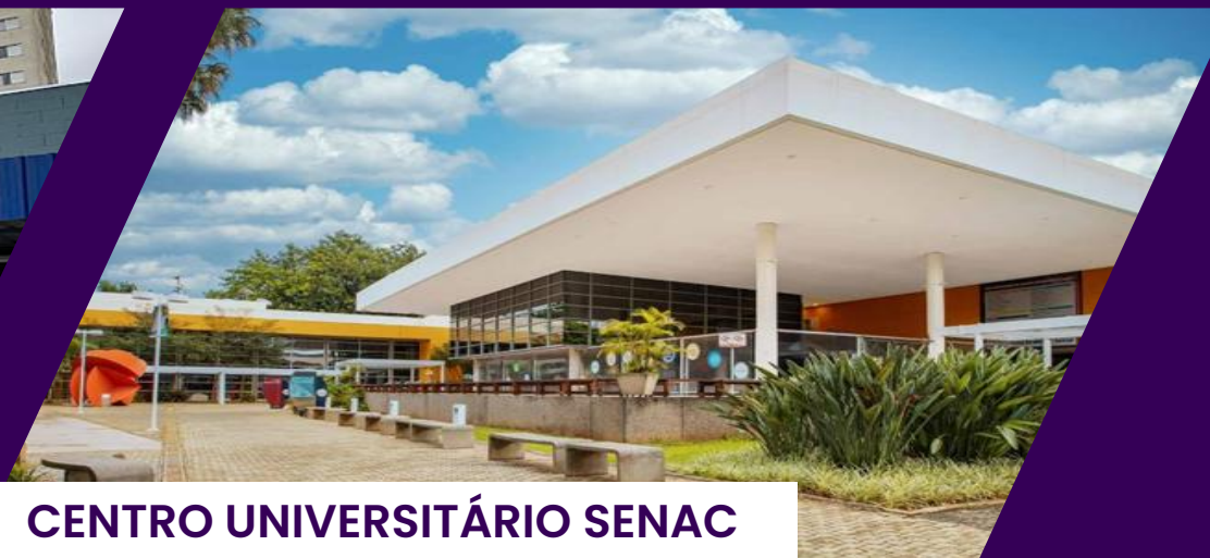
CENTRO UNIVERSITÁRIO SENAC