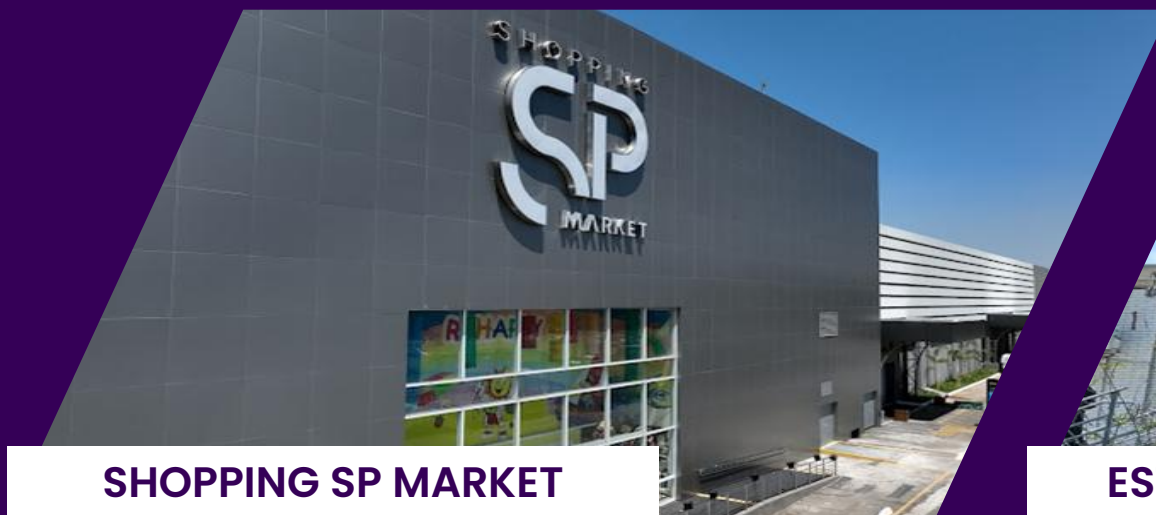
SHOPPING SP MARKET