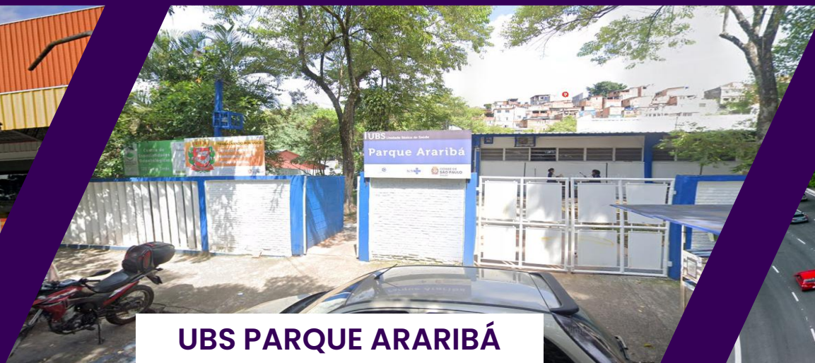
UBS PARQUE ARARIBÁ