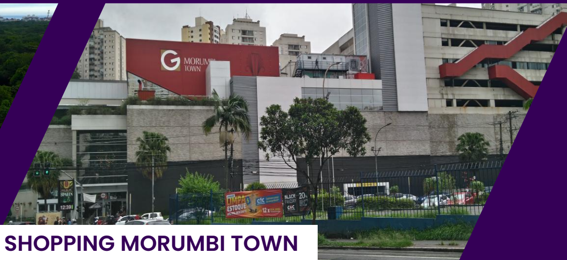
SHOPPING MORUMBI TOWN