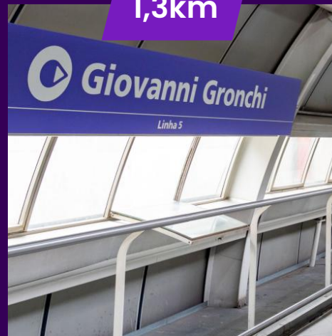
Estação Giovanni Gronchi