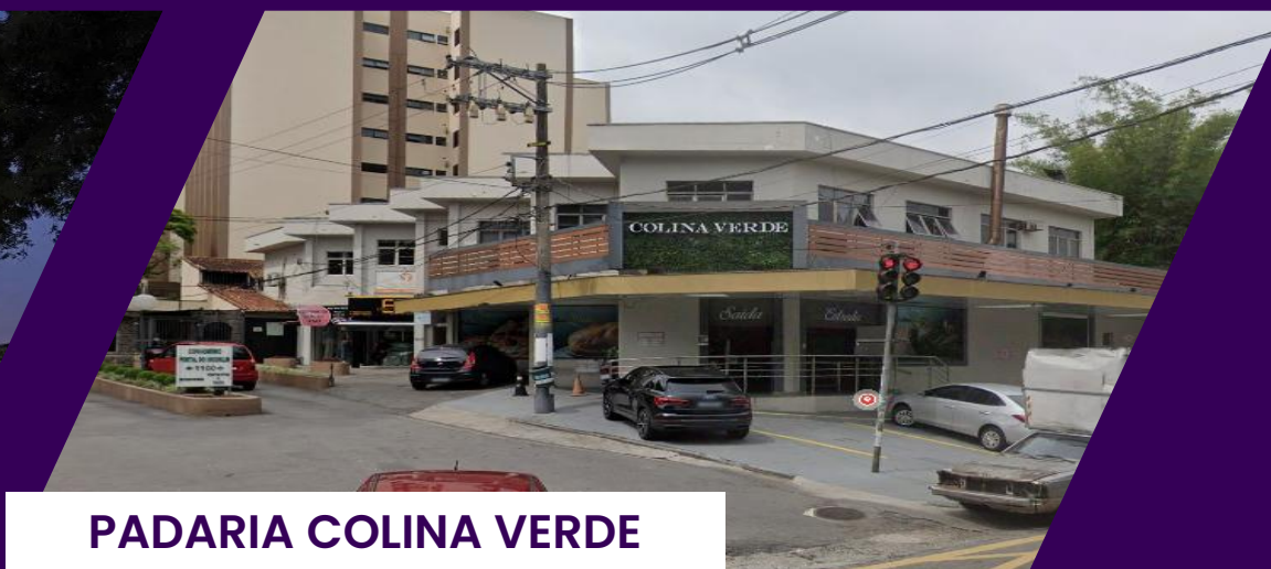
PADARIA COLINA VERDE