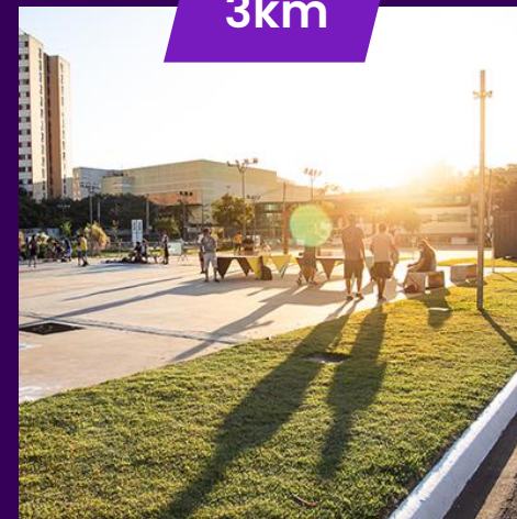
SESC Campo Limpo