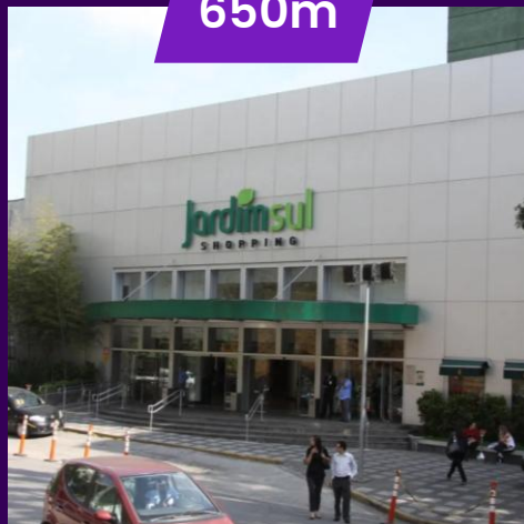
Shopping Jardim Sul