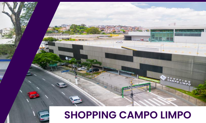
SHOPPING CAMPO LIMPO