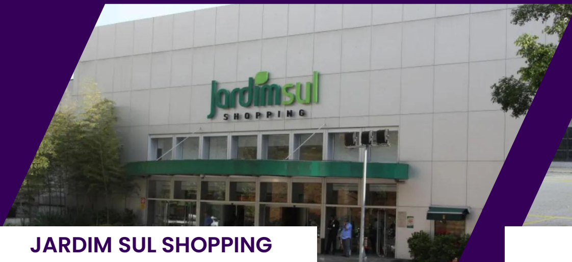
JARDIM SUL SHOPPING