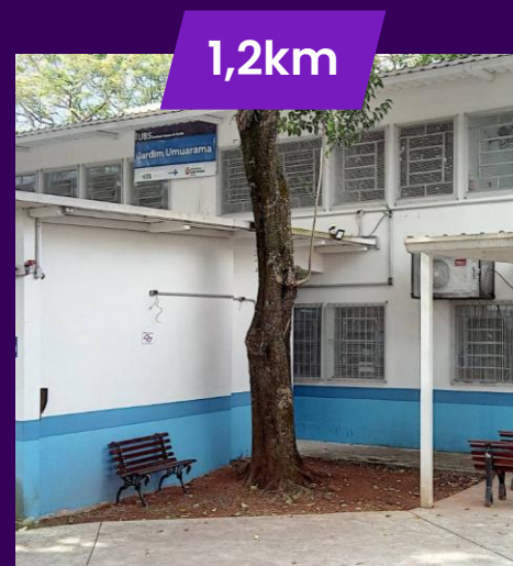
UBS Jardim Umuarama