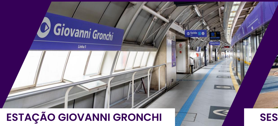
ESTAÇÃO GIOVANNI GRONCHI