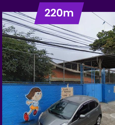
E.E. Guiomar Novaes