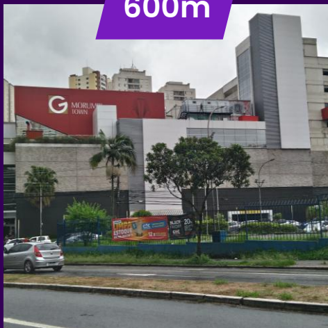
Morumbi Town Shopping