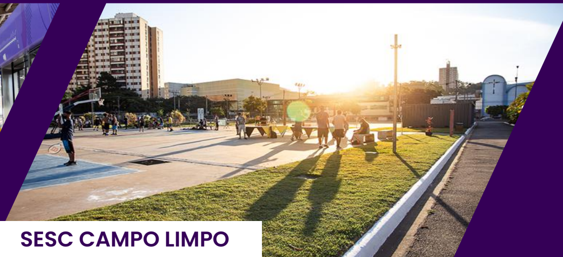
SESC CAMPO LIMPO